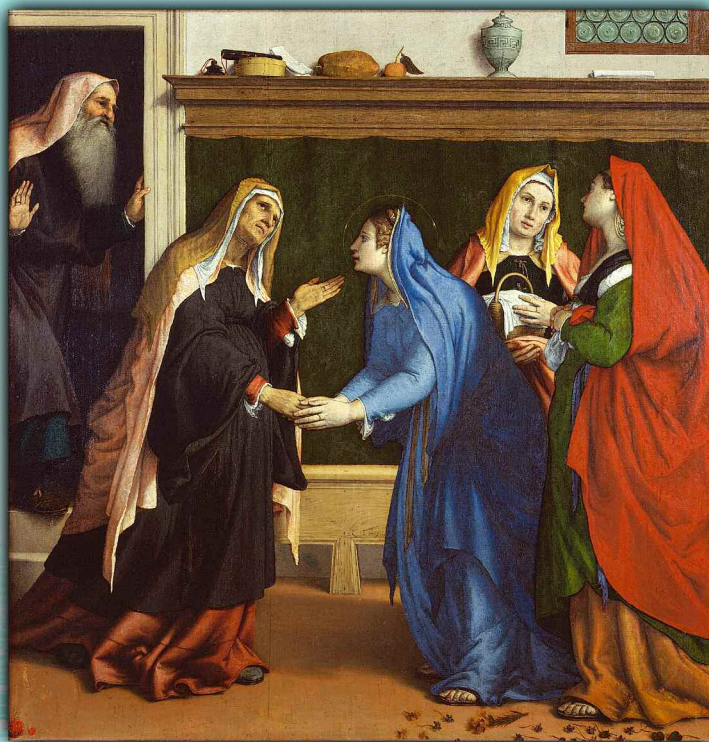
Visitazione, Lorenzo Lotto 1531 - Musei Civici di Palazzo Pianetti, Jesi

Una dialisi peritoneale di qualità nella pratica quotidiana